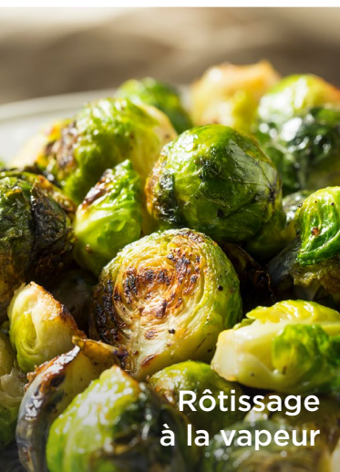
Rôtissage à la vapeur