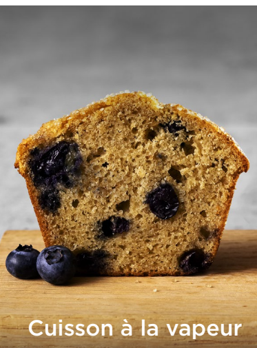
Cuisson à la vapeur