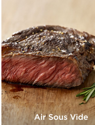
Air Sous Vide