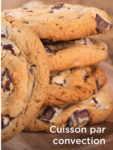
Cuisson par convection