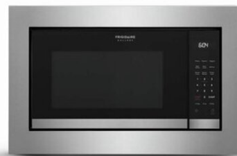
27" STAINLESS TRIMKIT (GMTK2768AF)