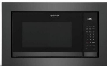
30" DARK STAINLESS TRIMKIT (GMTK3068AD)

* MICROWAVE (GMBS3068BD) PICTURED ABOVE PAIRED WITH BLACK STAINLESS STEEL TRIM KIT (GMTK3068AD / GMTK2768AD)