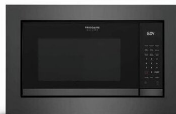
27" DARK STAINLESS TRIMKIT (GMTK2768AD)