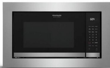
30" STAINLESS TRIMKIT (GMTK3068AF)

* MICROWAVE (GMBS3068BF) PICTURED ABOVE PAIRED WITH STAINLESS STEEL TRIM KIT (GMTK3068AF / GMTK2768AF)